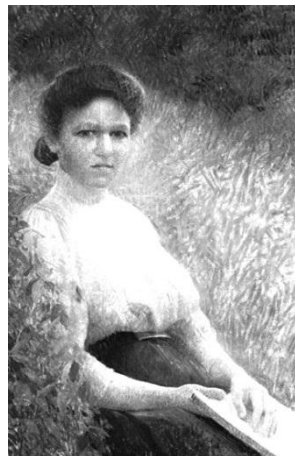
Дјевојка с књигом, 1908