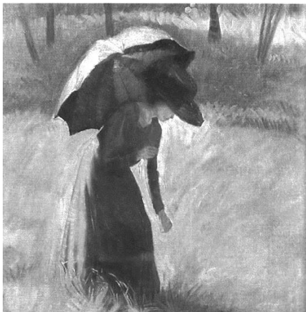
У шетњи, 1911.

Све чешће он погледа кроз прозор ("Поглед кроз прозор") и затим га