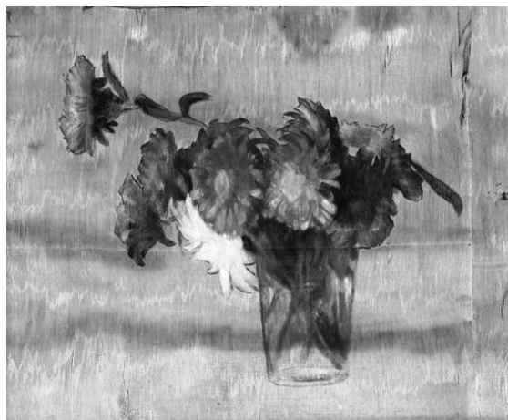
Мртва природа, 1903.