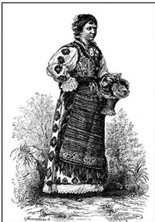
Слика 7. Савремена варијанта хрватске граничарске ношње