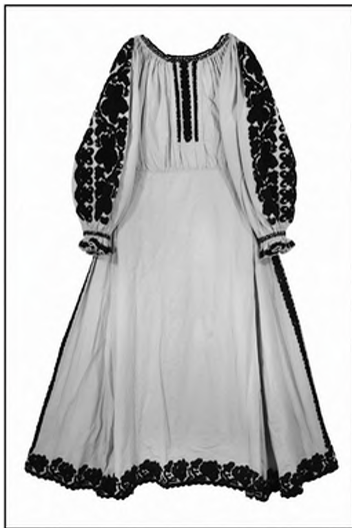
Слика 14. Коцу:џа из Окучана (Збирка народних ношњи Етнографског музеја у Београду)