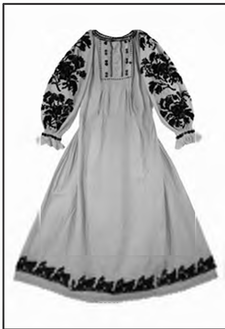
Слика 1. Реконструкција српске граничарске пошње из Горњег Чаглаћа, Горњи Чаглаћ 2012. године