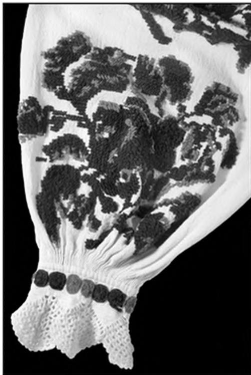
Слика 11. Флорални орнамент на рукаву кошуље (деталј веза)