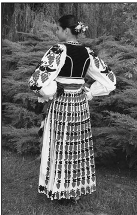
Слика 4. Реконструкција српске граничарске пошње из Горњег Чаглића