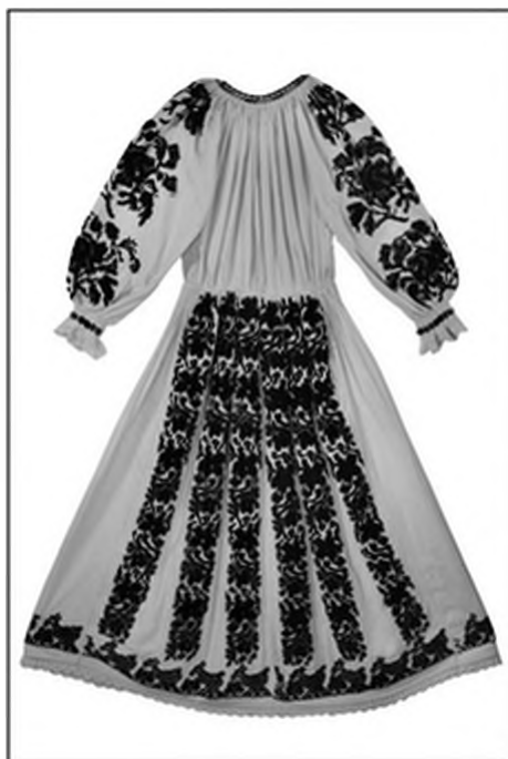
Слика 2. Кошуња једноделна рубиша из Горњег Чаглаћа