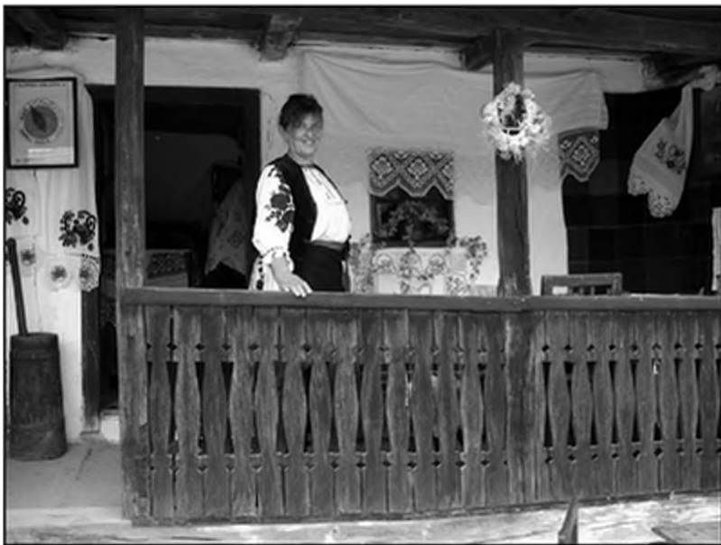
Слика 13. Кројна шема коцу:џе типа једноделне рудине (коцу:џа из Окучана, Збирка народних ношњи Етнографског музеја у Београду)