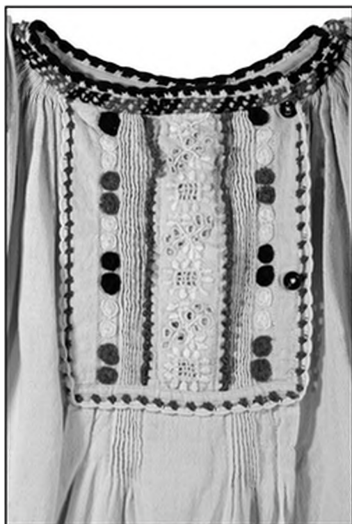
Слика 9. Недра копуље