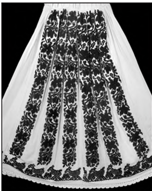
Слика 8. Вез на кошуљи из Горњег Чиглића