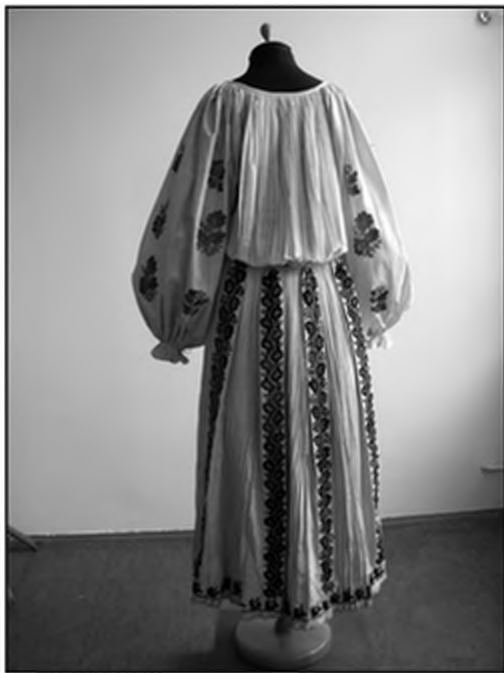
Слика 15. Кошуља из Левањске Вароши (Збирка народних ношњи Етнографског музеја у Београду)