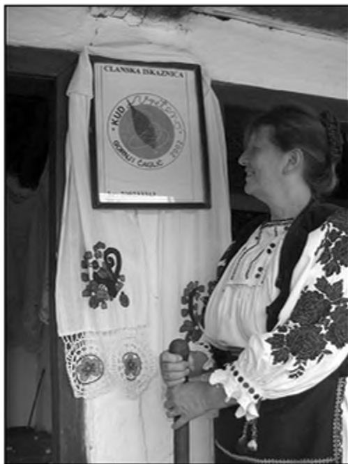
Слика 6. Сркиња из околине Накраца, око 1880.