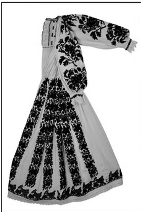
Слика 3. Паличе кочијубе из Г 1 Чаглића