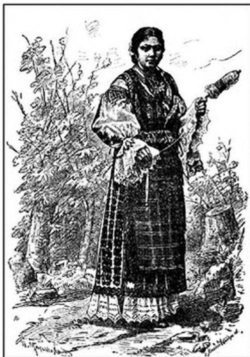
Слика 5. Сркиња из околине Накраца у Славонији, око 1880.